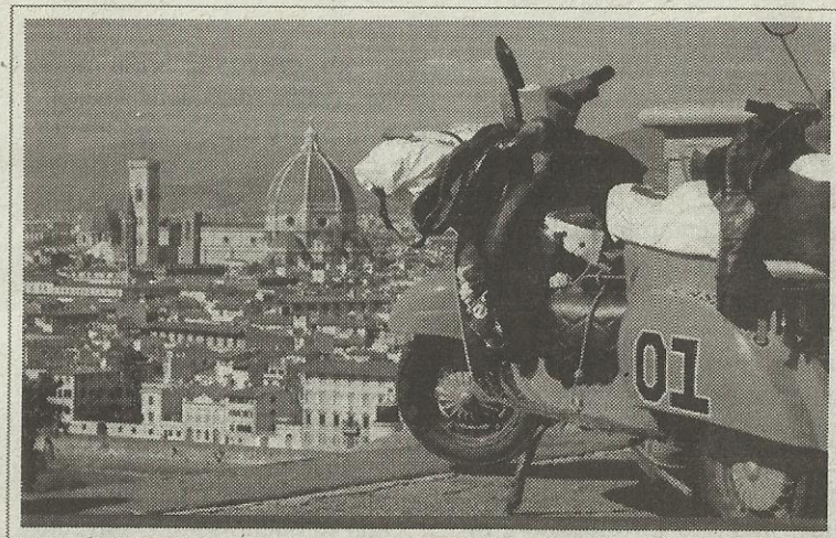
La Vespa "Generale Lee" a Firenze

Il libro "L'America in Vespa" - da Chicago a Los Angeles sulla